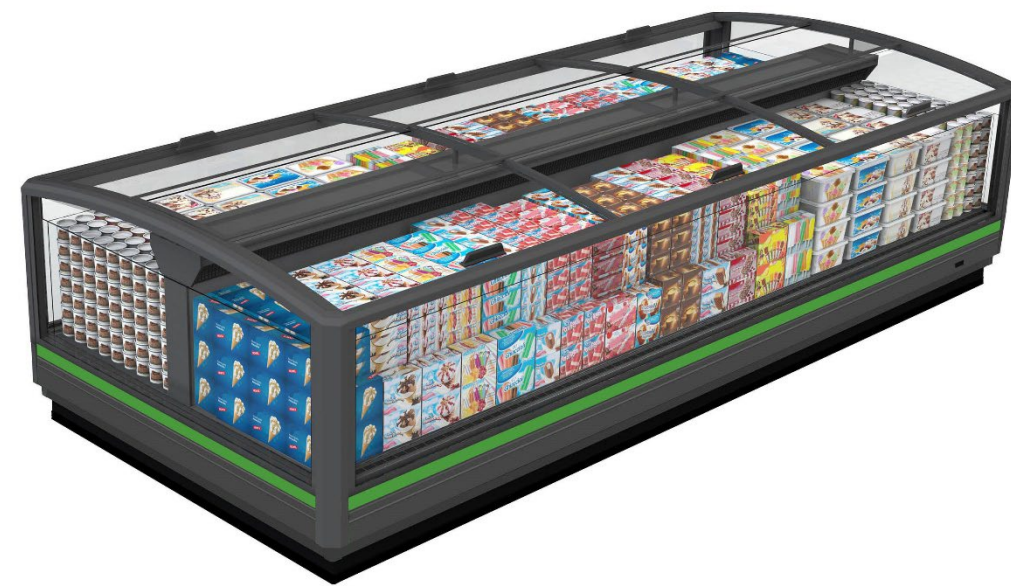
SkyExpo M (Modular)