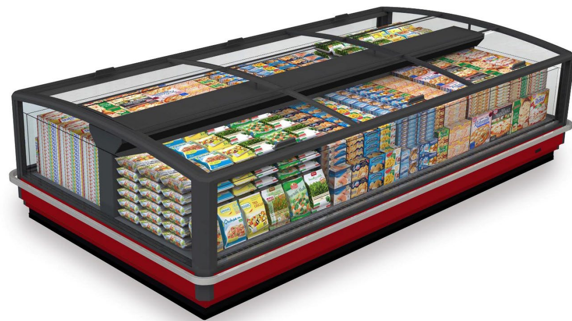
SkyExpo V (Volum)

La gamma di isole SkyExpo e SkySet portano massima trasparenza, visibilità ed elevati volumi espositivi nel reparto surgelati, rivoluzionandolo.