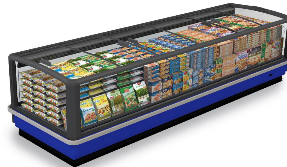
SkyExpo E (Efficia)