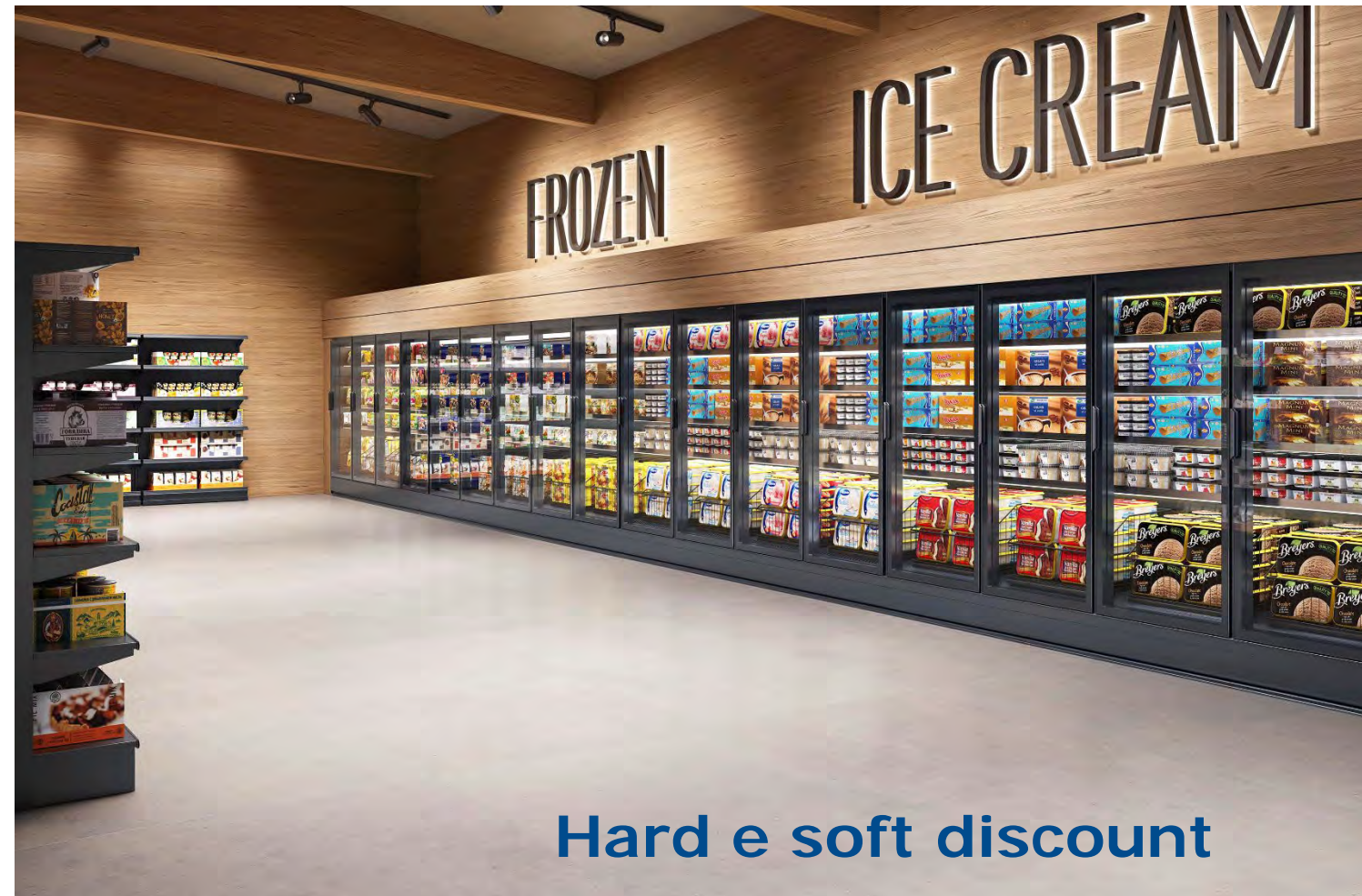
Hard e soft discount

SkyLight Integral Perform è perfetto per qualsiasi tipo di punto vendita al dettaglio