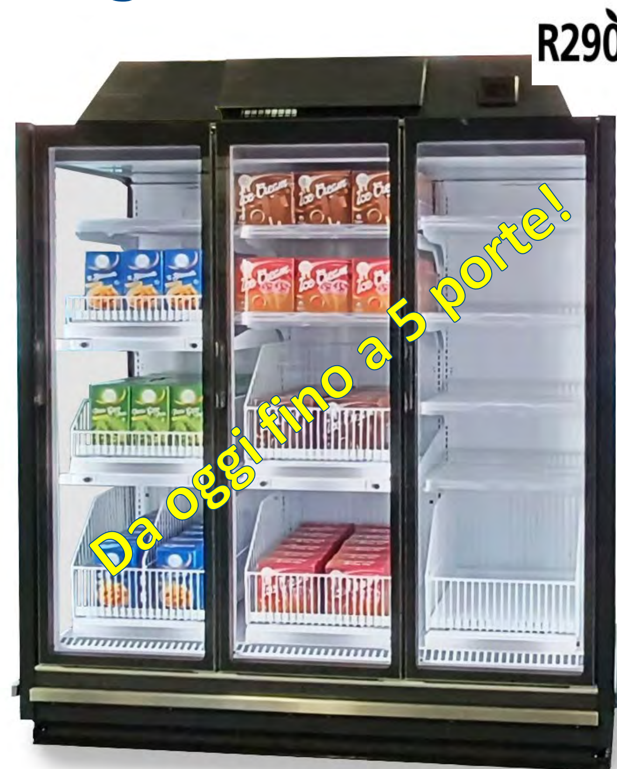
Nuovo SkyLight Integral Perform

Rispetto alla generazione precedente, SkyLight Integral Perform offre un risparmio d’energia fino a -30%, soluzioni d’esposizione più “intelligenti” e una gamma di personalizzazioni più ampia.