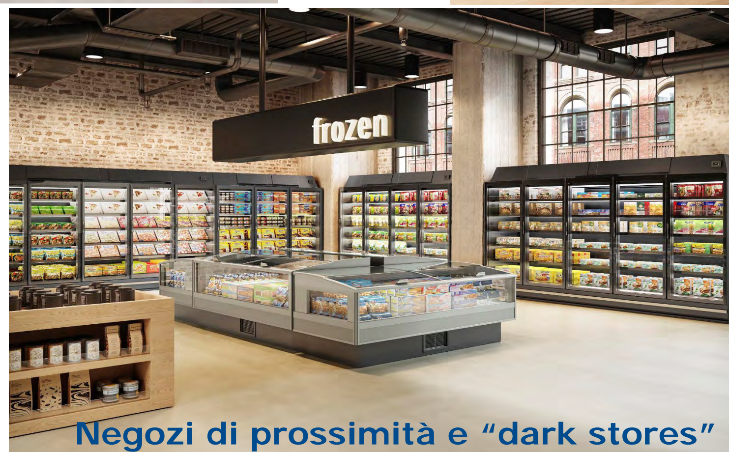
Negozi di prossimità e "dark stores"