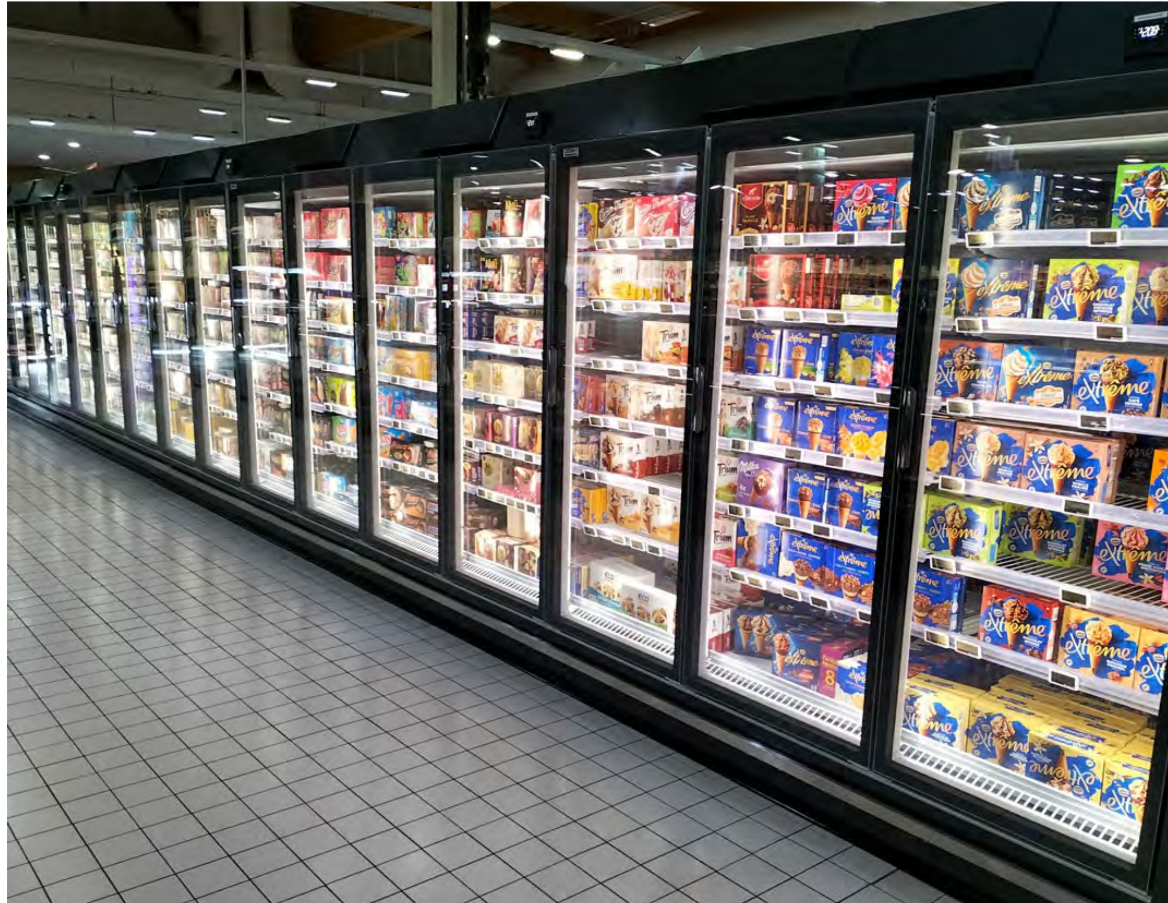
Lineare 17 porte SkyLight Integral Perform